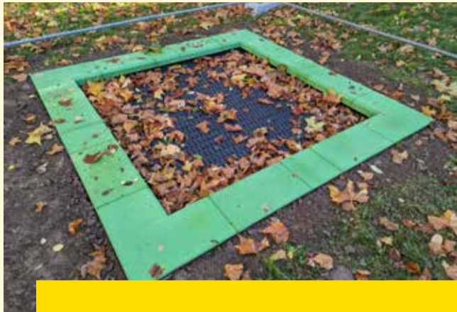
Das Bodentrampolin lädt zum Springen ein