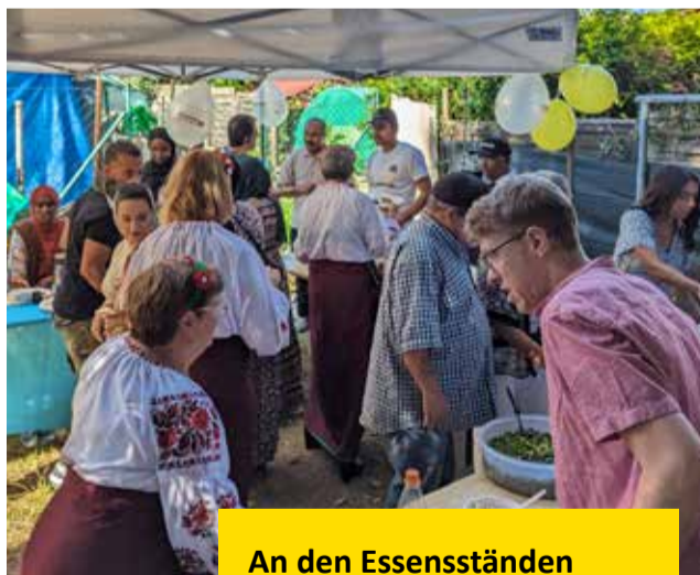
An den Essensständen herrschte großer Andrang

Im Garten des Quartiersbüros und auf dem benachbarten Spielplatz gab es viele gute Gespräche und fröhlich spielende Kinder vieler verschiedener Nationen. Die Menschen vor Ort freuten sich sehr über das gelungene Fest und wünschten sich von den Verantwortlichen: „Bitte organisiert so ein tolles Fest im nächsten Jahr wieder, es hat uns so viel Spaß gemacht!“ Finanziert wurde das Fest nicht nur über den Verfügungsfonds, sondern auch durch eine Sponsorschenschaft des Rheinhessen Centers und des Kauflands Alzey.