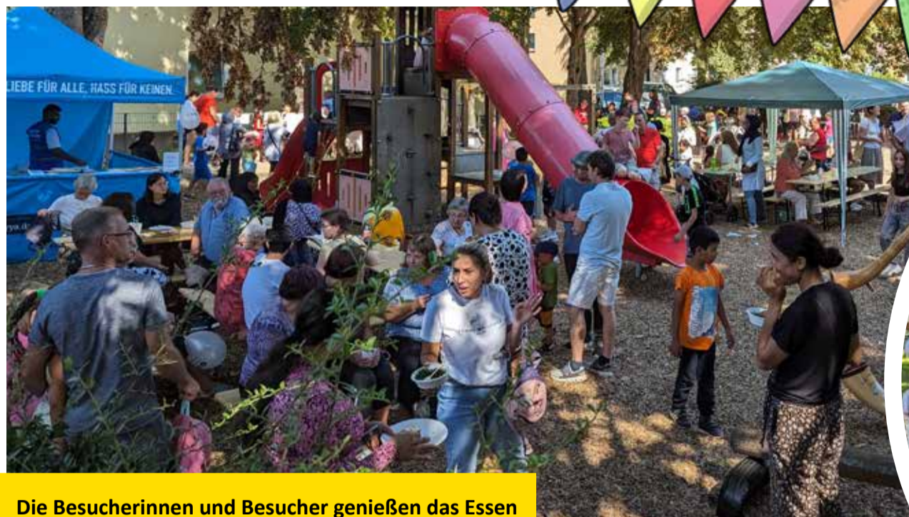
Die Besucherinnen und Besucher genießen das Essen und die Musik bei bestem Spätsommerwetter