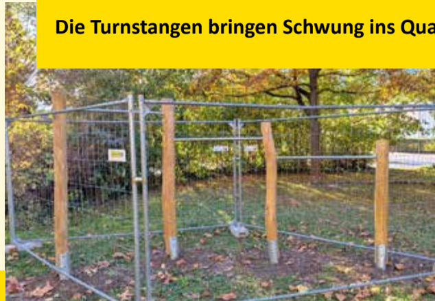
Die Turnstangen bringen Schwung ins Quartier