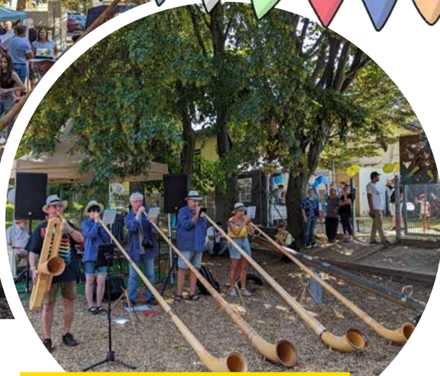
Die Alphornbläserinnen und Alphornbläser sorgen für alpenländische Stimmung