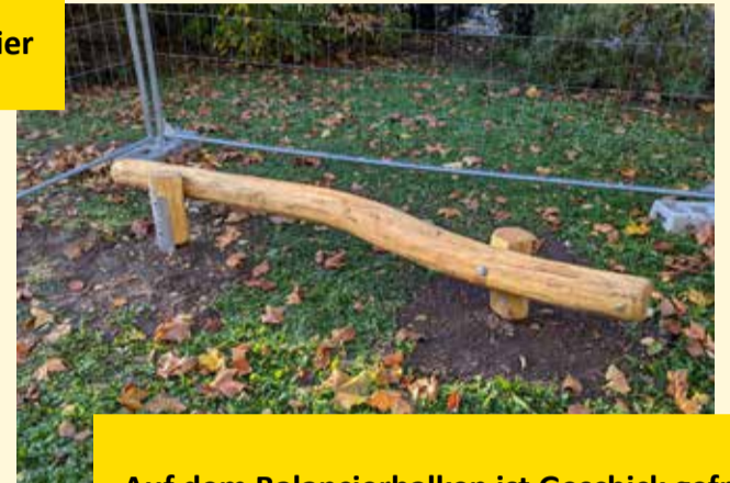
Auf dem Balancierbalken ist Geschick gefragt

Im Rahmen des diesjährigen Tags der Städtebauförderung lud das Quartiersmanagement alle Bewohnerinnen und Bewohner des Alzeyer Ostens zu einer Bürgerbeteiligung ein. Abgestimmt werden konnte über eine Maßnahme, die noch 2023 umgesetzt