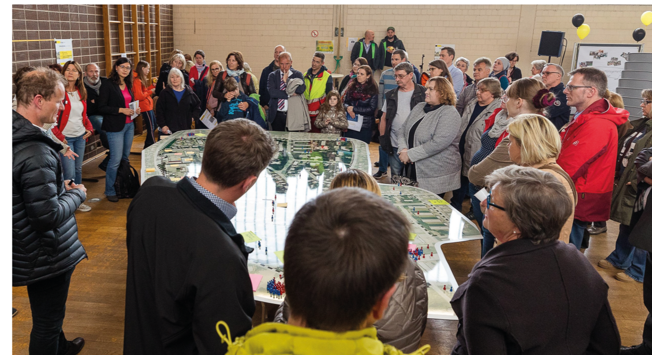
Die gut besuchte Auftaktveranstaltung zeigt, wie groß das Interesse an dem Projekt der Sozialen Stadt ist

Die Auftaktveranstaltung der „Sozialen Stadt – Alzeier Osten“ am 6. Mai 2019 lockte zahlreiche Interessierte in die Turnhalle der Nibelungenschule. Die Bürgerinnen und Bürger nutzten die Gelegenheit, um den Stadtplanern des beauftragten Büros ausgiebig auf den Zahn zu fühlen und Themen anzusprechen, die ihnen am Herzen liegen.